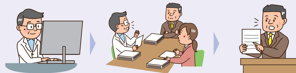
①事前に決定した手順に従い、論文を選別

事業者の都合で機能性があることを示す論文だけを意図的に抽出することはできません。